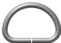
Med Arg 25