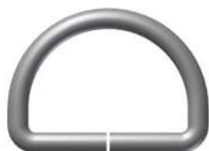
Med Arg 22