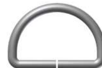
Med Arg 19