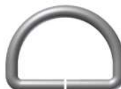
Med Arg 16