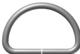
Med Arg 32